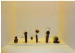
▲講師展「小さな空間」

講師展では、「小さな空間」というテーマで、木の実にラグラスという植物を分解し貼り付けています。