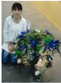
▲熊本県文化懇話会

熊本県文化懇話会の作品は、細竹で傘の形を作りクレマチスの花で模様をデザインしています。