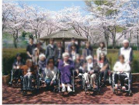
▲柿原公園で入院患者さんのお花見 さくらがきれいですね!