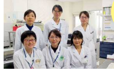
臨床検査科 スタッフ