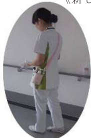
《新しい介護職員の制服》