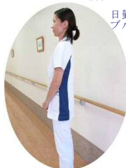
《新しい看護職員の制服》

各部署から人選した、制服改定プロジェクトを立ち上げ、看護、介護職員7名で、世代、男女を考慮した、まず自分達が着て働きたい制服を選びました。そして、日勤と夜勤の区別をしようと考えました。