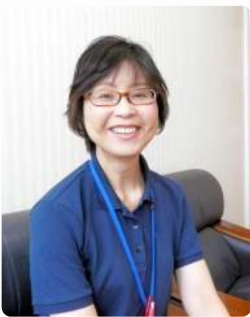
医療法人金澤会 青磁野リハビリテーション病院 副看護部長・総合連携室