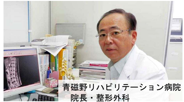
青磁野リハビリテーション病院 院長・整形外科

ロコモの状態かをチェックする方法として、次の項目があります。 Let's check! ↗