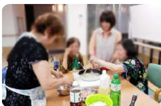
楽しく親子井づくり

主な活動内容は、趣味活動(料理・編み物・縫い物・さくらほりきり・アクセサリー作り、ガーデニングなど)、元気リハビリ、個別でのゆったり入浴、行きたい所への外出、物作りにこだわったバザーなどを行っています。