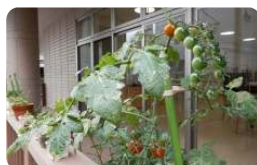
ベランダで実った プチトマト